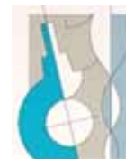
IRCCS CROB RIONERO