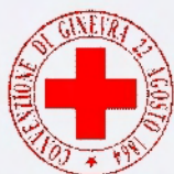
Croce Rossa Italiana