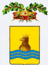
Provincia di Potenza