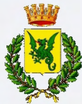
Comune di Venosa