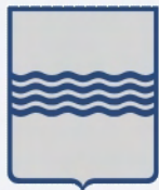
Giunta Regionale della Basilicata