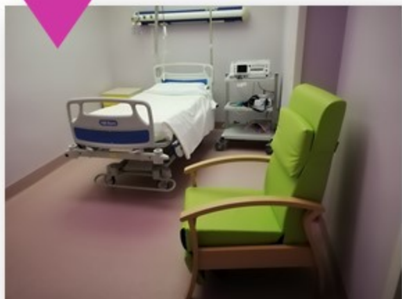
Stanza travaglio e parto alla sale - parto