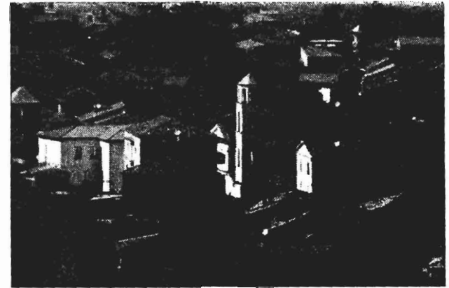
Uno scorcio di Tramutola

le attività dell'ASP che, tra l'altro, assicura prestazioni di ricovero qualificate nell'hospice dell'Ospedale di Lauria per pazienti in fase terminali, che per varie ragioni non possono essere assistiti a domicilio e dove vengono effettuate cure palliative con assistenza psicologica e spirituale. Nessuna richiesta di assistenza domiciliare per pazienti oncologici risulta essere stata non accolta dalle strutture dell'Azienda Sanitaria di Potenza che avrebbe provveduto a dare risposta alle istanze dei familiari.