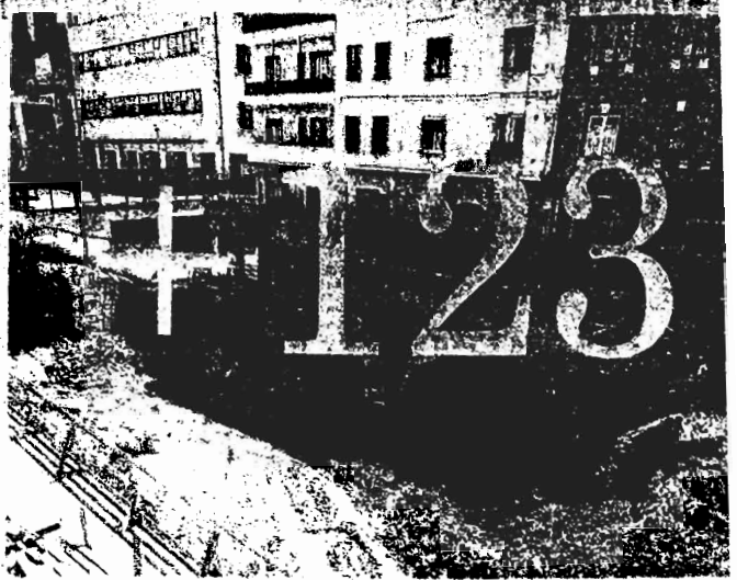
CANTIERE Un'altra estate «prigionieri» delle transenne