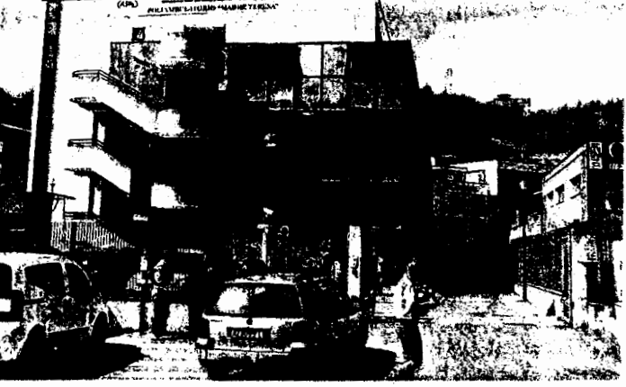
EDIFICIO L'attuale sede del Poliambulatorio in via del Gallitello, a Potenza. Si vuole trasferire la struttura nei locali lasciati vuoti dagli uffici dell'ospedale San Carlo