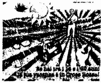
posti in regione sono due: il primo si

Al via le iscrizioni per l'edizione 2013 di «Campo giovani», il progetto, giunto alla quinta edizione, promosso dal Dipartimento della Gioventù e del Servizio Civile Nazionale in collaborazione con i Vigili del Fuoco, la Marina Militare, le Capitanerie di Porto e la Croce Rossa Italiana. Da giugno a settembre studenti e studenti residenti in Italia, di età compresa tra i 14 ed i 22 anni (20 anni per i campus estivi della Croce Rossa), potranno essere protagonisti per una settimana di iniziative in difesa dell'ambiente e in aiuto alla popolazione. Una settimana per appren-