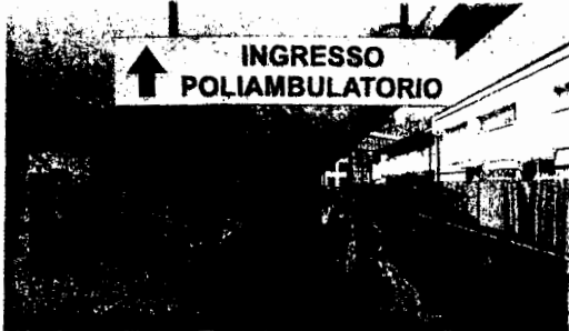
SEDE L'ingresso principale del Poliambulatorio