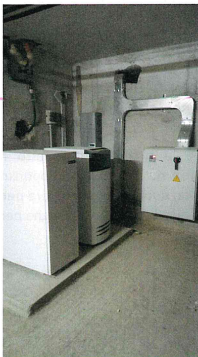
Fig. 2 – Impianto UPS (Uninterruptible Power Supply – gruppo di continuità)